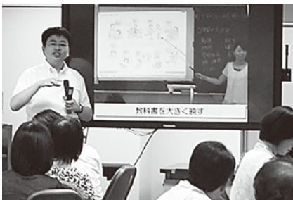
児童生徒のICT活用の充実と情報モラル指導研修会 (児童生徒のICT活用コース)8月1日 「ICTを活用した授業づくりに関する講演」