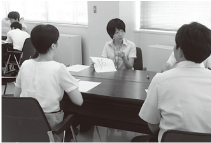
若手教員研修(2年次教員研修会)8月8日 「カウンセリング演習(高等学校)」