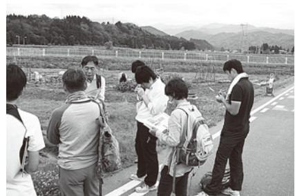
理科教育講座(自然観察)6月7日 「学校周辺の植物、昆虫等の観察(立山町)」