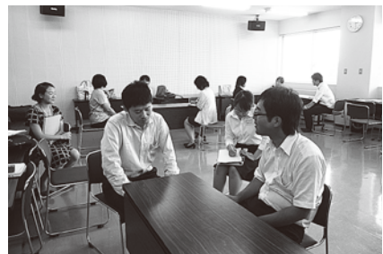
学校カウンセリング講座9月14日 (面接・面談コース) 「ロールプレイによる演習」