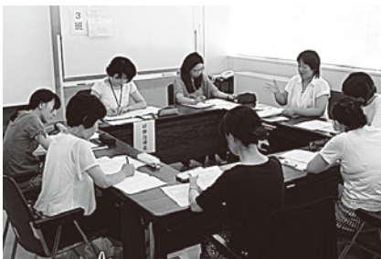
基礎と実践を学ぶ 特別支援教育コーディネーター研修会8月25日 「班別協議」