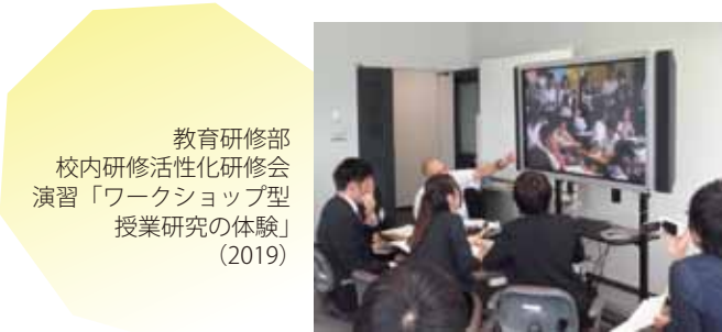
教育研修部 校内研修活性化研修会 演習「ワークショップ型 授業研究の体験」 (2019)

代表 TEL (076) 444-6161 ウェブサイト http://center.tym.ed.jp/ 代表 FAX (076) 444-6170 E-mail : center@tym.ed.jp