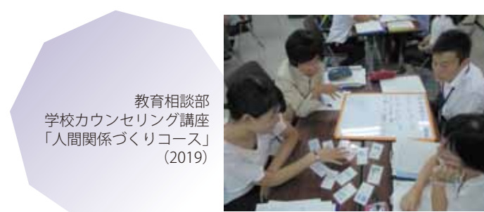
教育相談部 学校カウンセリング講座 「人間関係づくりコース」 (2019)