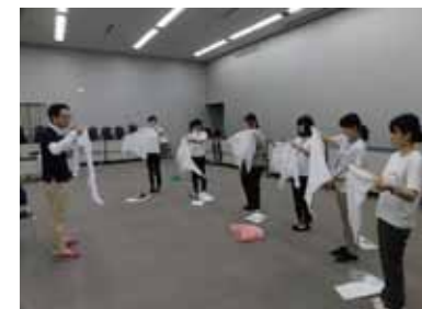
教育研修部 新規採用教職員研修会 (養護教諭) 「保健管理・応急処置」 (2019)