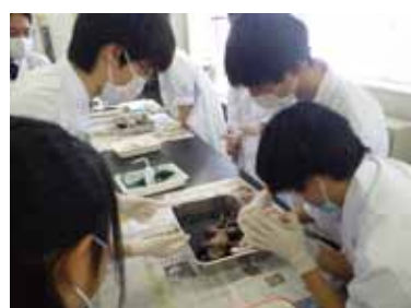
科学情報部 生徒実習 「カエルの解剖」 (R2)