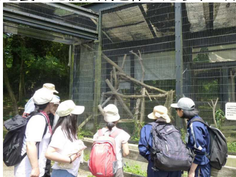
「なんていうヤマネコかな」